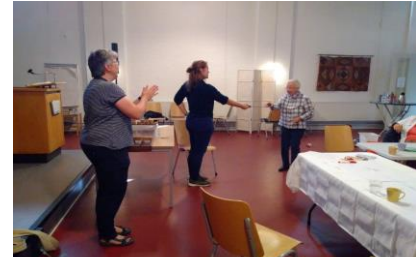
Uitreiking gouden sjoelsteen

Afkomst is hierbij niet van belang, maar veelkleurigheid maakt het wél mooier. Bezoekers uit Syrië, Irak en andere landen verwelkomden we met vreugde dit seizoen.