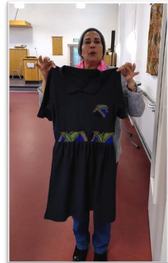
Foto: Een jurkje gemaakt van een gekregen T-shirt.

We hopen in 2022 voor nog meer vrouwen én mannen een plek te zijn om handwerkvaardigheden op te doen, te oefenen met het Nederlands (ook dat gebeurt op naailes) en met elkaar in verbinding te komen.