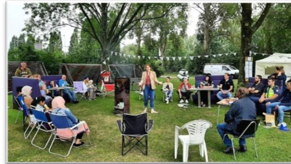
Foto: Kinderverhaal rond het kampvuur op zondag.

Het voortraject was intensief. Er waren meerder teamvergaderingen waarbij buurtbewoners elkaar leerden kennen, trainingssessies van de Buurtcampus, en meetings met de gemeente en politie. In mei was er een Buurtcamping Startdag en in juni en juli drie bouwdagen om bekendheid te geven en de camping voor te bereiden.