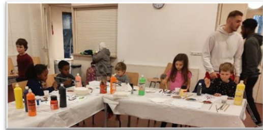
Foto: knutselmiddag georganiseerd door de stagiairs.

In november en december organiseerde de stagiairs van Curio MBO Social Work een knutselmiddag en een filmmiddag. Alle kinderactiviteiten werden goed bezocht.