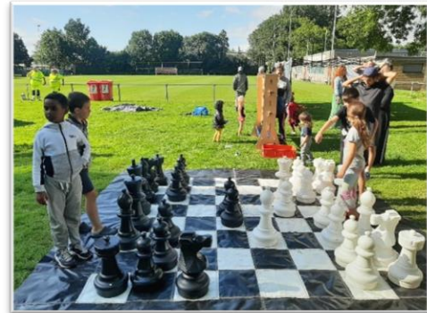
Foto: Kinderen spelen bij de buurtcamping.

In dit jaarverslag leest u op welke manier Hart voor Breda Noord present was in 2021. Er wordt teruggekeken naar 2021 en daarmee ook vooruitgekeken naar 2022: wat kan er doorgaan, waar liggen kansen. Veel leesplezier gewenst!