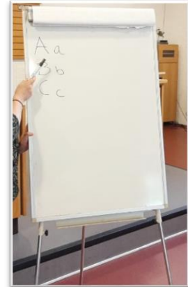
Foto: Taalles begint bij het ABC.