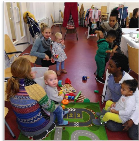
Foto: Op vrouwenochtend voelen ook de kinderen zich helemaal thuis.

In 2021 werden er 3 vrouwenochtenden gehouden. Er werd gestart met een nieuwe planning: normaliter zijn de ochtenden tweewekelijks, uitsluitend in het winterseizoen. Nu is de vrouwenochtend maandelijks, het gehele jaar. Daarnaast zijn de ochtenden verschoven van de donderdag (marktdag) naar de woensdag, wat zichtbaar tot meer diversiteit van bezoekers heeft geleid.