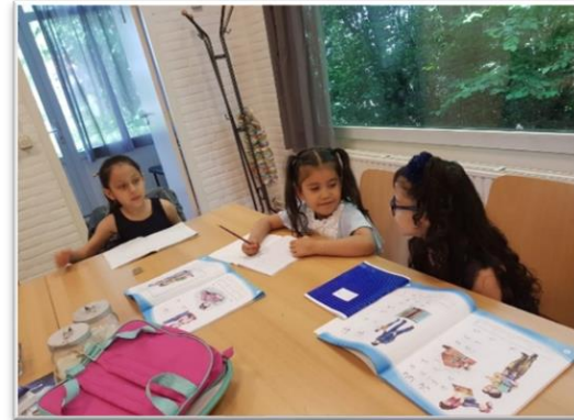
Foto: Arabische taalles met Arabische werkboeken.

Veel leerlingen spreken thuis nog (deels) Arabisch en het is belangrijk dat zij het ook leren lezen en schrijven. De lessen worden gegeven door twee vrouwen uit Irak met jarenlange ervaring als leerkracht in Irak. Helaas kon ook dit door de lockdown regelmatig niet doorgaan, maar wanneer mogelijk werden de lessen goed bezocht.